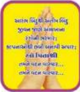
પિતાશ્રી ભાણજી માલશી ગાલા

કાર્યક્રમ બાદ ગૌતમ-પ્રસાદ (ભોજન)ના પુણ્યશાળી દાતા